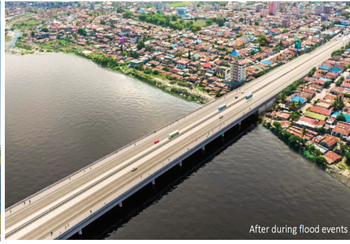
After during flood events